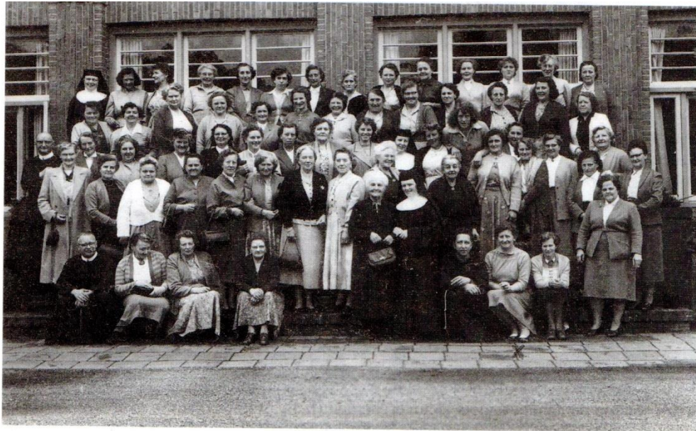
2. Met de vrouwen in 1955 op retraite bij de redemptoristen in Bergen in Noord-Holland.