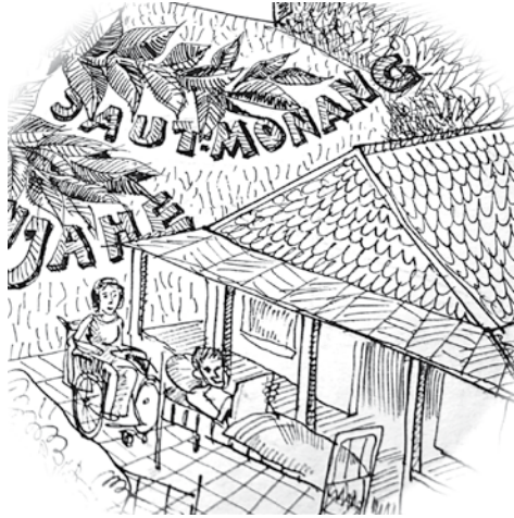
Het eerste huurhuis.

Maar ongeveer 4 jaar geleden is hij opgenomen in het huurhuis, dat we toen hadden en hebben we beugels en stokken voor hem laten maken, sindsdien gaat hij naar school en hij zit nu al in de vierde.”